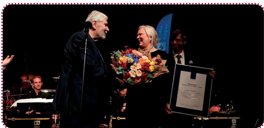
Boris Cavazza je letošnji prejemnik nagrade Franeta Milčinskega Ježka.

Vrhunec letošnjega praznovanja je potekal v ponedeljek, 7. oktobra, v Kulturnem domu Nova Gorica, kjer so na slavnostnem koncertu nastopili Big Band RTV Slovenija, Lara Jankovič, Marko Hatlak, Rudi Bučar in Iztok Mlakar. Na kon-