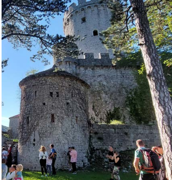
DOSEŽKI PRETEKLEGA MANDATA: Obnova gradu Rihemberk

Brv čez Sočo • Prenovljen del Delpinove ulice • Nov turistično informacijski center in center trajnostne mobilnosti s prometno ureditvijo dela Kidričeve ulice • Nov center za obiskovalce na Sabotinu • Center tehniške dediščine Kuj.me v Lokovcu • Obnova gradu Rihemberk z infoteko Natura 2000 • Urejanje turistične ponudbe na Lokvah • Urejanje vzletišča Lijak • Nov moderen pokrit bazen • Urejane Cankarjeve soseske • Otvoritev muzeja tihotapstva na Pristavi • Pasji park • Novo otroško igrišče v Ozeljanu • Obnova igrišča na Pristavi • Preureditev nogometnega igrišča ob Kornu • Ureditev športnega igrišča OŠ Fran Erjavca • Obnova nogometnega igrišča pri OŠ Kozara • Prenovljena telovadnica OŠ Frana Erjavca • Ureditev kolesarske steze po delu Vojkove ulice • Urejena kolesarska in sprehajalna pot ob Kornu • Čezmejna kolesarska povezava • Vzpostavitev sistema izposoje koles Go2Go • Sistematično urejanje ekoloških otokov • Prenova prvomajske ulice • Prometna ureditev trga Evrope • Ureditev parka miru na Prevalu • Vzpostavitev tematske poti ob Vipavi • Vzpostavitev centra ponovne uporabe