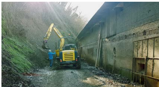
DOSEŽKI PRETEKLEGA MANDATA: Sanacija plazov

predmetov "Muca Cupatarica" v Solkanu • Dokončanje izgradnje doma krajanov v Oseku • Sanacija mestne tržnice • Izgradnja vrtca Grgar • Energetska sanacija in obnova OŠ Milojke Štrukelj • Omogočanje razvoja domačega podjetništva na Ravnici • Začetek urejanja poti na Kapelo • Postavitev dehidracijskega WC v skateparku • Dogovor s SENG za zagotavljanje večje varnosti uporabnikov reke Soče • Pridobitev sofinanciranja za odvodnika Soča in Koren ter protipoplavne zaščite Rožne Doline • Povečanje kvot subvencioniranega prevoza pitne vode • Xcenter, vozlišče ustvarjalnih •