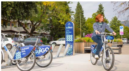
DOSEŽKI PRETEKLEGA MANDATA: Čezmejna izposoja koles Go2Go

Razvita Evropa ima sodobno železniško omrežje. Dohitevamo jo! Skupaj z državo bomo nadaljevali posodabljanje železniške postaje in iz Nove Gorice naredili železniško vozlišče, ki s primestno