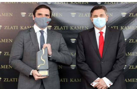
DOSEŽKI PRETEKLEGA MANDATA: Zlati kamen za najbolj prodorno občino

Do cilja bomo pripeljali načrtovane poslovne cone . Nove površine za investicije in razvoj gospodarstva bomo vzpostavili v prenovljeni poslovni coni na območju nekdanje tovarne pohištva v Kromberku in razširili našo najuspešnejšo gospodarsko cono Solkan .